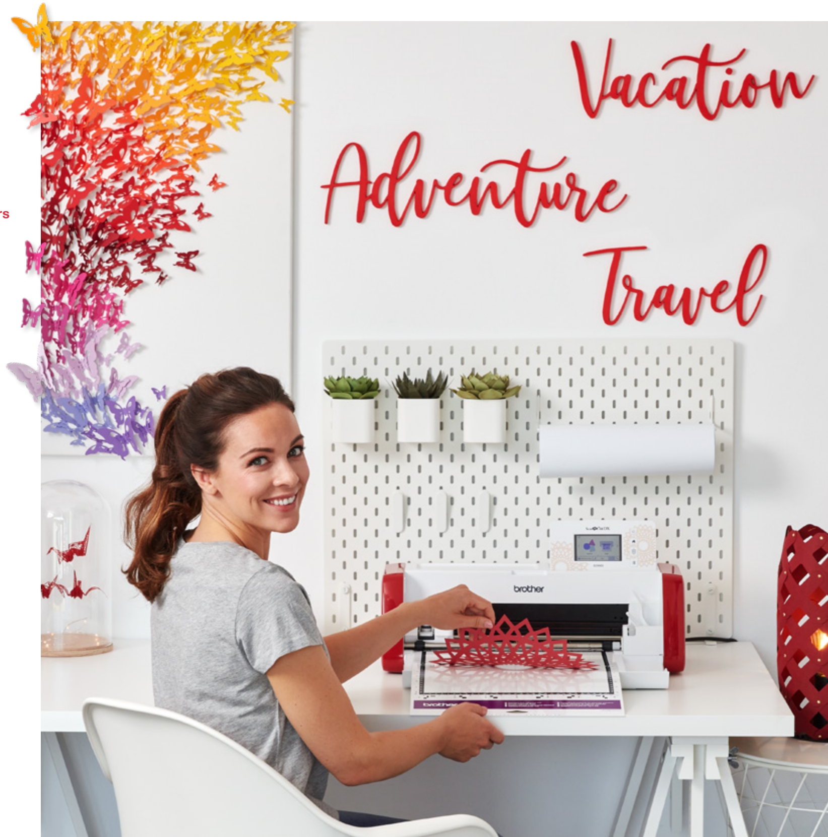
Vacation = Vacances / Adventure = Aventure / Travel = Voyage

Dédiez votre temps à la création ! La SDX900 lit les fichiers SVG - sans conversion préalable.